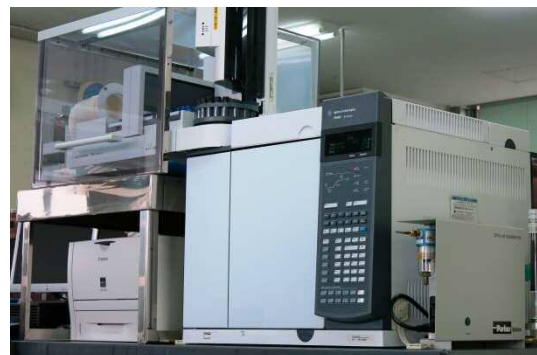
ガスクロマトグラフ (GC)