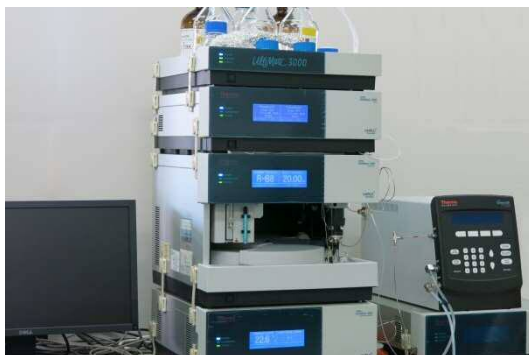
液体クロマトグラフ (HPLC)

流体として、窒素やヘリウムガスなど気体を使用するものをガスクロマトグラフ、有機溶媒や水など液体を使用するものを液体クロマトグラフと呼ぶ。