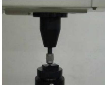
ロックウェル硬さ計測定部