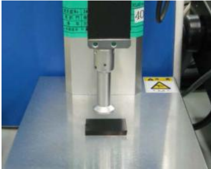
デュロメータ硬さ計測定部