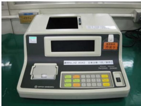
測定装置外観写真

JIS K7105:1981 プラスチックの光学的特性試験方法 JIS K7136:2000 プラスチック-透明材料のヘーズの求め方 JIS K7361-1:1997 プラスチック-透明材料の全光線透過率の試験方法